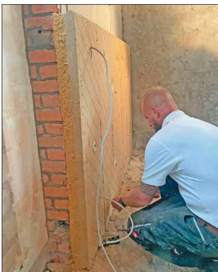
Die Dämmplatten schmiegen sich mit ihrer weichen Seite direkt an die Mauer an.

führerin vom UdiDämmsysteme. Das Chemnitzer Unternehmen lieferte die Holzfaserdämmplatten. „Nur so konnte beim Atelierhaus die ursprüngliche Fassade mit ihrer Holzverkleidung erhalten bleiben.“