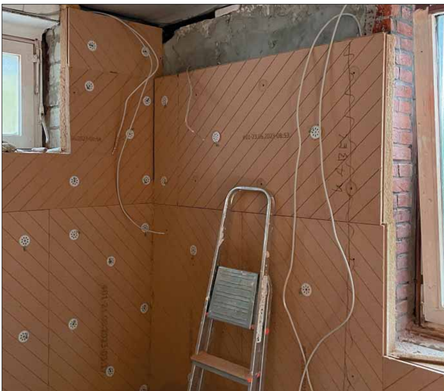
Die Widerhaken der Dübel verkrallen sich in den Dämmstoff, dadurch werden die Holzfasern unter Aufnahme hoher Zugkräfte an die Wand gepresst.

Das Holzfaser-Dämmsystem UdiReco bietet den Vorteil einer einfachen Montage: Es kommt ohne Unterkonstruktion oder Klebstoff aus. Die biegsamen Platten, bei denen im Atelierhaus eine Stärke von 80 mm genügte, schmiegen sich mit ihrer weichen Seite direkt an die Mauer an. So lassen sich unebene Ziegelwände bis zu einer Differenz von 2 cm ausgleichen. Beim Verschrauben krallen sich die Widerhaken des Dübels in den Dämmstoff, dadurch werden die Holzfasern unter Aufnahme hoher Zugkräfte an die Wand gepresst.