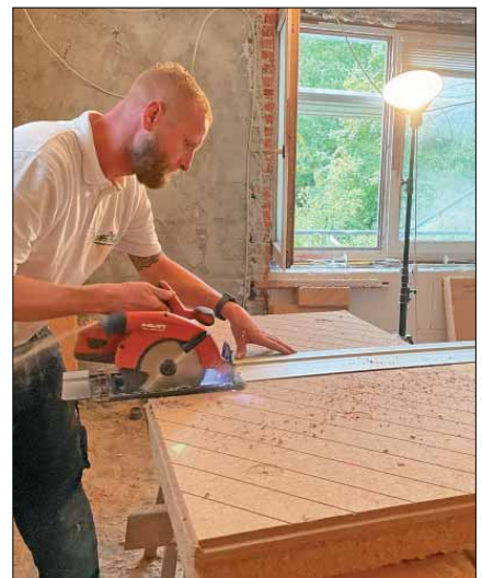
Zuschneiden der Holzfaser-Dämmplatten. Sie kamen im Kunsthaus Fleer in einer Stärke von 80 mm zum Einsatz.