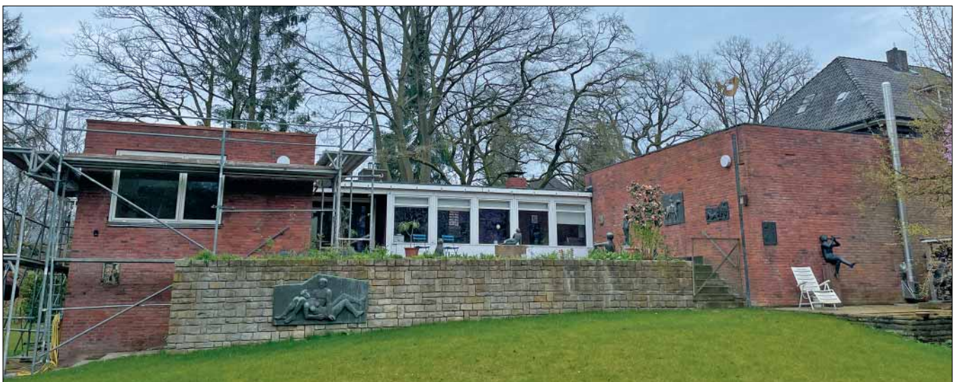
Dem Abriss entronnen: Die Stadt Hamburg stellte das Gebäude 2021 unter Denkmalschutz.