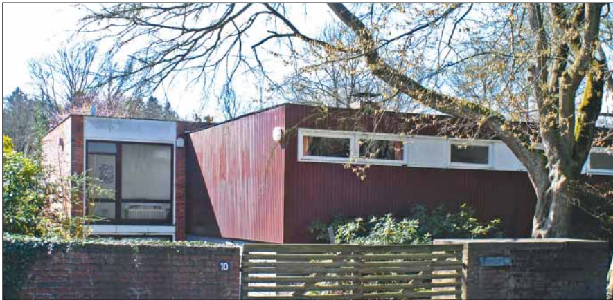
Der Bungalow stand seit 2017 leer und war in einem so schlechten Zustand, dass Sachverständige den Abriss forderten.