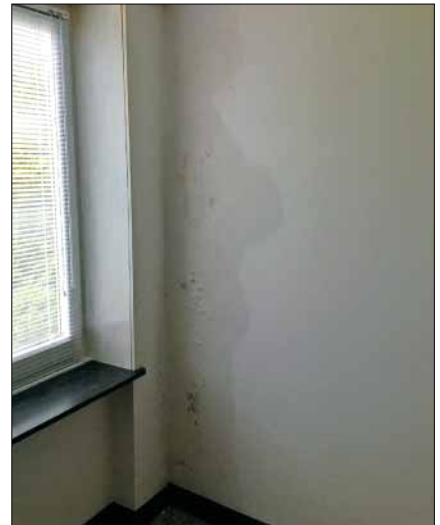
Feuchte Wände waren gestern. Heute unterstützt ein durchgängig diffusionsoffenes Holzfaser-Dämmsystem ein angenehmes Raumklima.